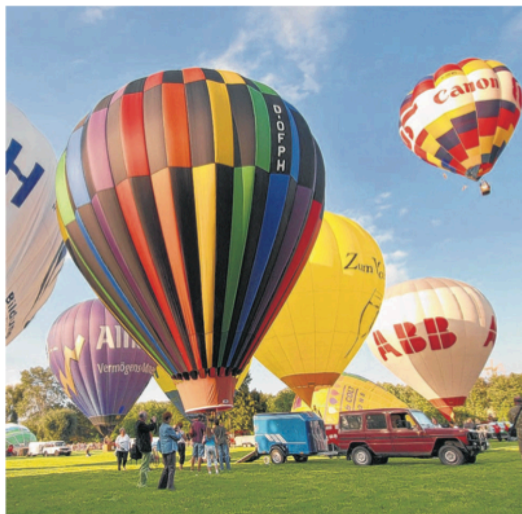
Seit 2005 ein Großereignis in Ladenburg: Für 2010 hat der Veranstalter Heidelberg-Ballon das große Festival überraschend abgesagt.

Aufgrund des lebhaften Interesses auch der Medien hatten die Veranstalter laut Bering eine weitere Steigerung des Besucherandrangs in diesem Jahr erwartet. Dem wollte Heidelberg-Ballon professionell Rechnung tragen. Eine solche Ver-