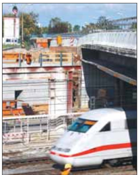
Die Brücke in Waldhof quert die Bahntrasse und die Sonderburgerstraße. F. Rittelmann

Nach dem Startschuss bewegten die Pressen die Brücke mit einer Geschwin-