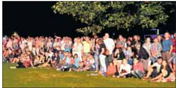
Fasziniert verfolgten Tausende von Zuschauern auf der Freizeitanlage den Aufstieg der Ballons.

Das hatte sich offenbar bei den Besuchern herumgesprochen. Die nutzten den Sonntag deshalb gerne zu einem Parkbesuch. Mit zunehmender Dunkelheit schlugen die Flaneure im Park dann immer stärker die Richtung zur Freizeitanlage ein. Dort sollte in den späten Abendstunden das große Ballonglühen stattfinden. Zur Einstimmung gab es zunächst einmal die begeisternde Feuer- und Lichtjonglage der Firedancers. Auch für die weiter entfernten Zuschauer ein beeindruckendes Erlebnis, wenn die Flammenkreuze durch die Äste der Bäume aufblitzten, unterstützt von exotischen Didgeridoo und Schlagzeug, visuell untermalt von den ersten vier Ballons. Ein toller Auftakt für das, was noch kommen sollte.